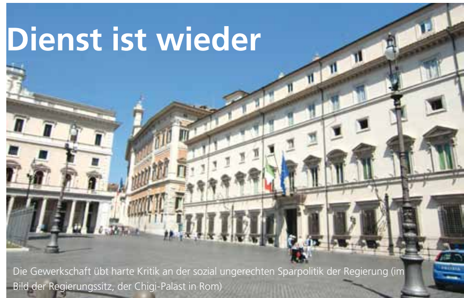
Die Gewerkschaft übt harte Kritik an der sozial ungerechten Sparpolitik der Regierung (im Bild der Regierungssitz, der Chigi-Palast in Rom)

Für die Jahre 2011, 2012, 2013 und nun mit dem neuen Finanzgesetz auch noch für 2014 werden jegliche Vertragsverhandlungen zur wirtschaftlichen Anpassung der Gehälter ausgesetzt. Der letzte wirtschaftliche Teil unseres Vertrages wurde für das Biennium 2007-08 abgeschlossen. Die Anpassung für das Biennium 2009-10 ist noch zu verhandeln. Dazu muss allerdings erst der bereichsübergreifende Vertrag der Landes-